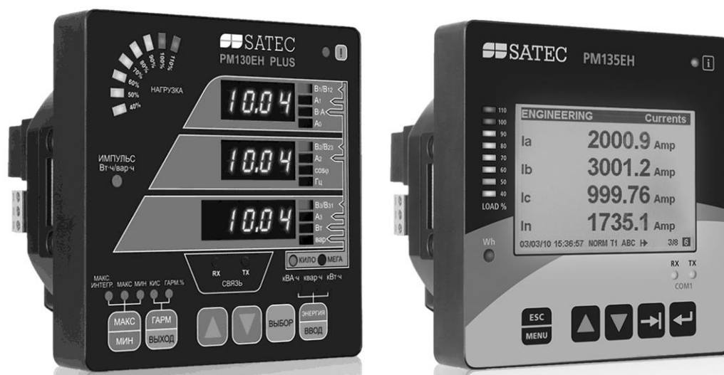
Рисунок 1 - Внешний вид измерителей модификаций PM130EH Plus и PM135EH

Конструктивно измерители выполнены в ударопрочном пылезащитном корпусе и представляют собой цифровые приборы, внешний вид которых представлен на рисунке 1.